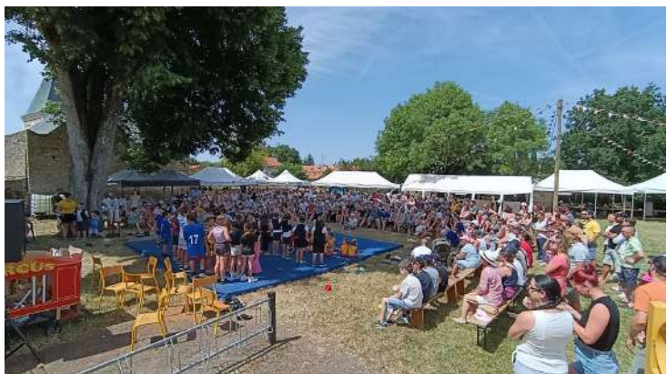
A 15h, les danses des enfants ont réuni toutes les familles. A l'ombre du grand chêne, le spectacle est agréable.