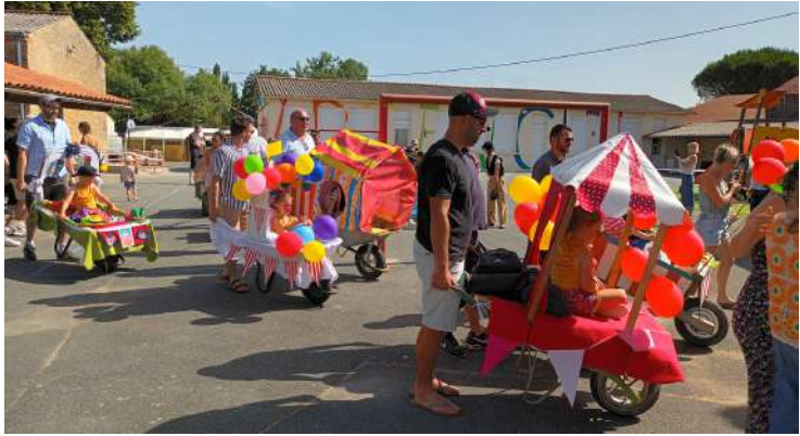
Le défilé dans le bourg de Ste Cécile a débuté à 10h30. En tête de cortège : les enfants regroupés par classe et les brouettes confectionnées par les parents des petits de maternelle.

La fin de l'année aura été marquée par notre Kermesse, le dimanche 14 juin. Entre deux période de forte chaleur, nous avons eu de la chance de bénéficier d'un temps clément. Petits et grands ont pu profiter de la journée. Nous remercions tous les parents et amis qui ont donné un coup de main avant, pendant et après cette grande journée.