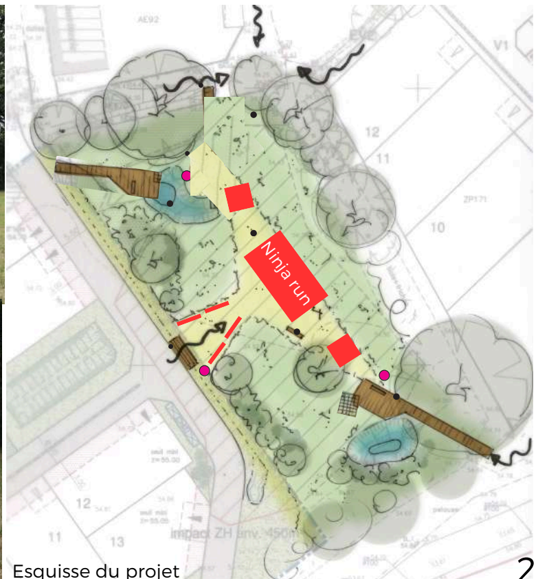
Esquisse du projet