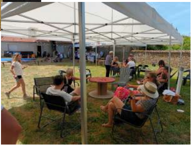
Pendant que les enfants s'amuse, les plus grands ont pu profiter d'un bar ombragé et d'un espace détente accolé.