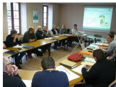
Réunion Trame verte et bleue et agriculture à Bournezeau

Depuis le mois de juillet 2017, les élus sont entrés dans la phase de construction du Projet d'Aménagement et de Développement Durables (PADD) qui constitue l'élément central du PLUi en présentant ses grandes orientations :