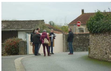
Diagnostic en marchant à Saint-Vincent-Sterlanges